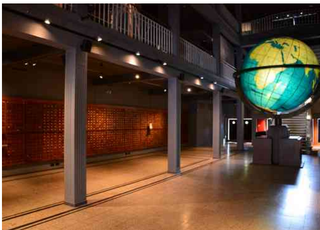
Mondaneum – 76 rue de Nimy, 7000 Mons

Paul Otlet viel met een 163 ste plaats buiten de lijst van de 100 Grootste Belgen.